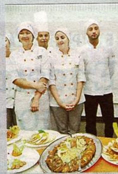
Presentación de la comida tica en el plan.

Para este año, el programa pretende capacitar a más de 220 cocineros y 200 bartender, mediante 10 talleres, para que se ofrezca en restaurantes y hoteles comidas y bebidas ticas.