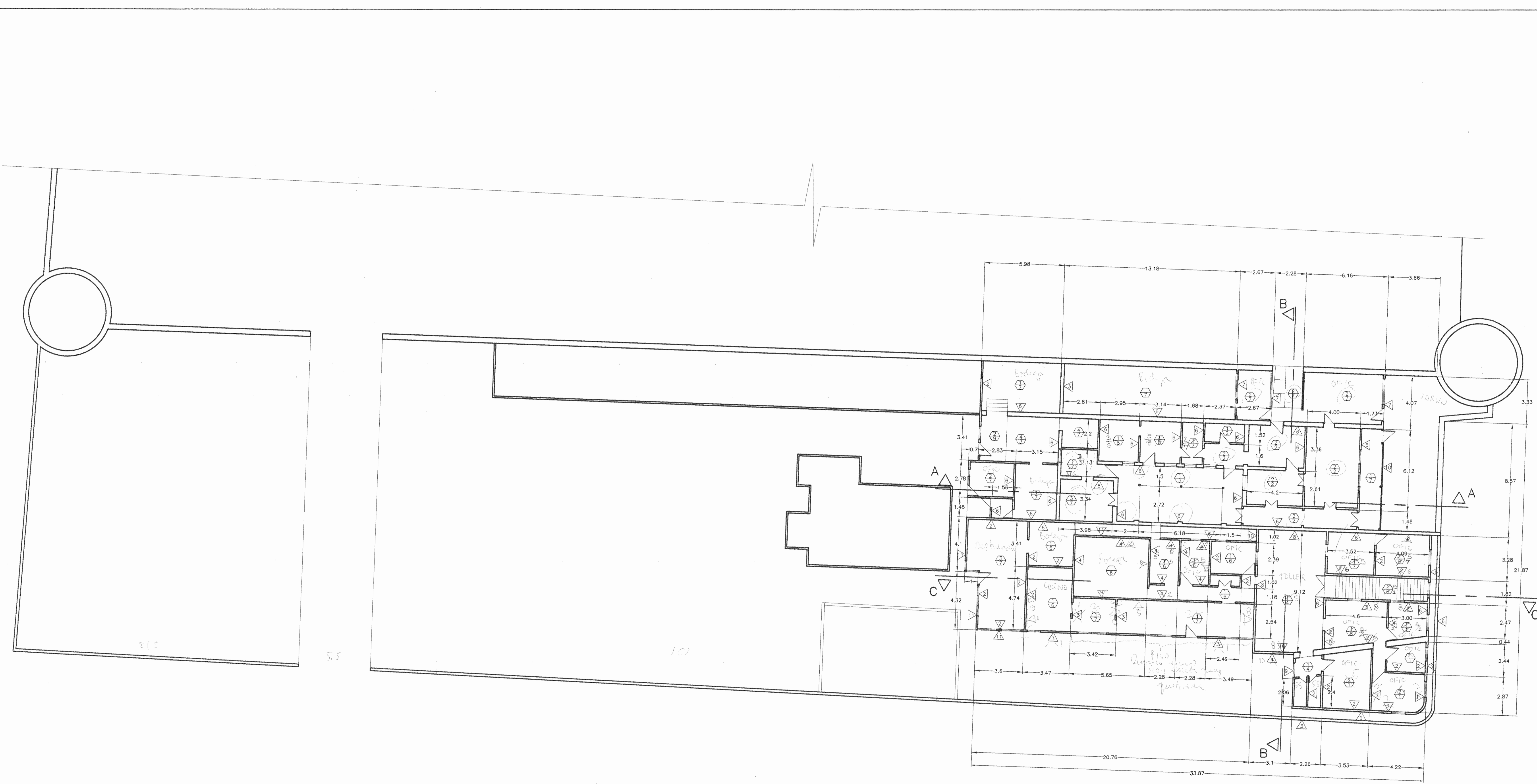
PLANTA DE DISTRIBUCIÓN ARQUITECTONICA