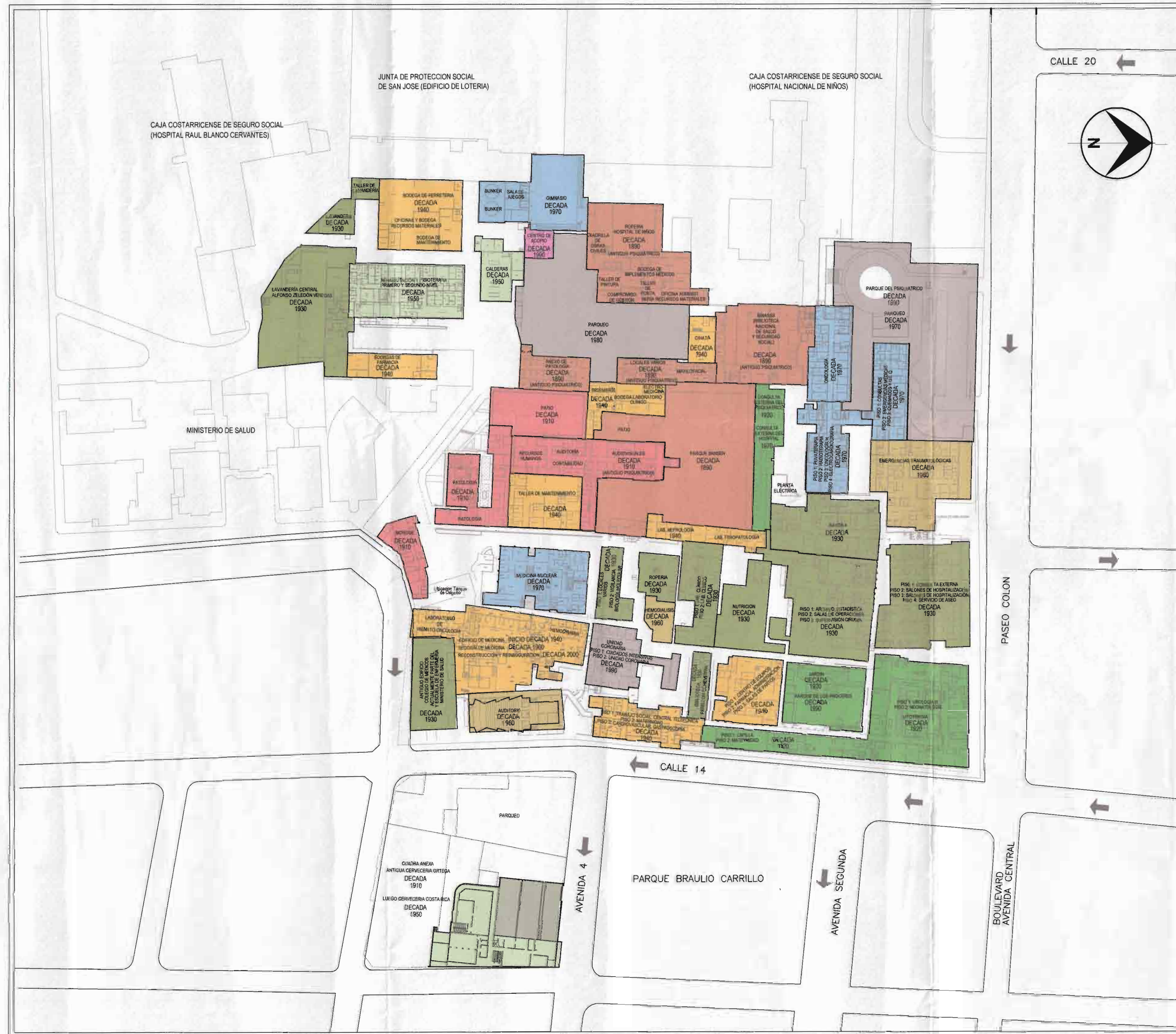
PLANTA DE CONJUNTO ESCALA 1:1000