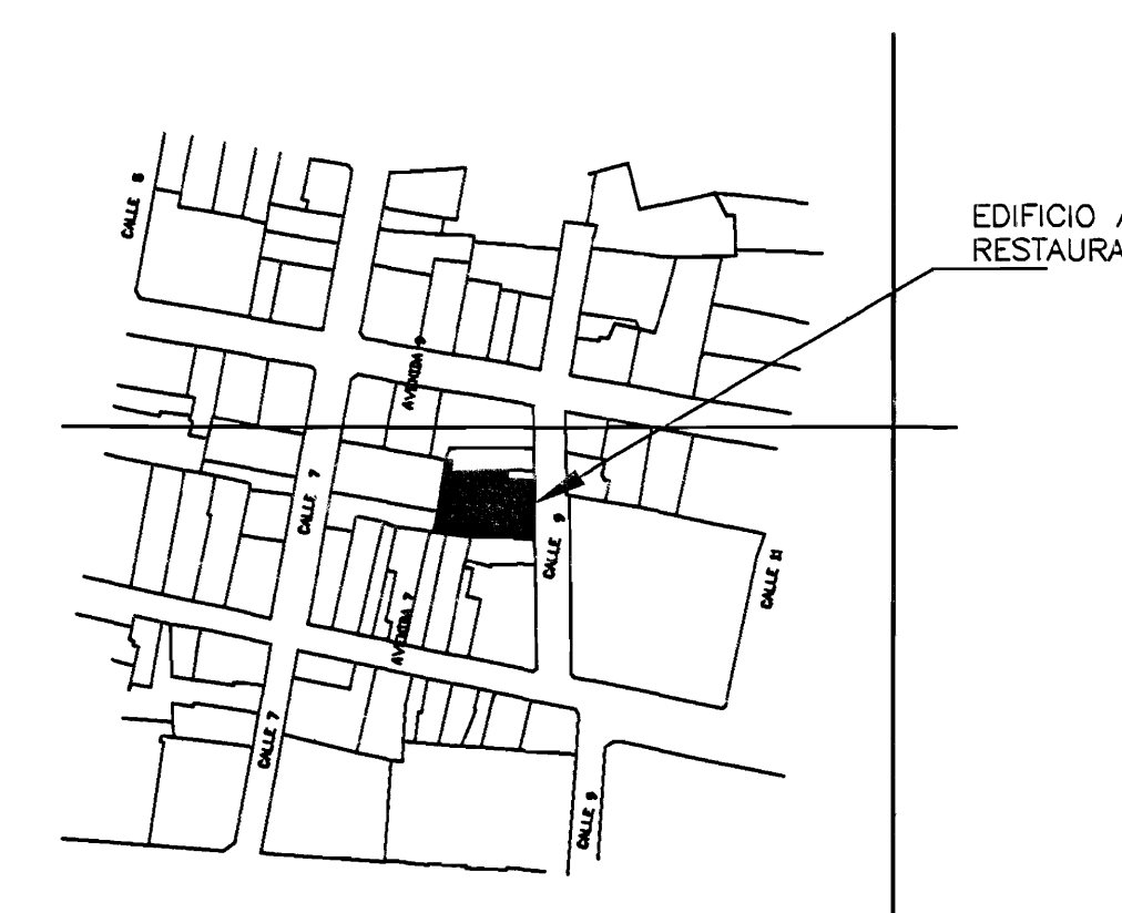
LOCALIZACION DISTRITO EL CARMEN SIN ESC.

aprobacion comision revisora de permisos de construcción