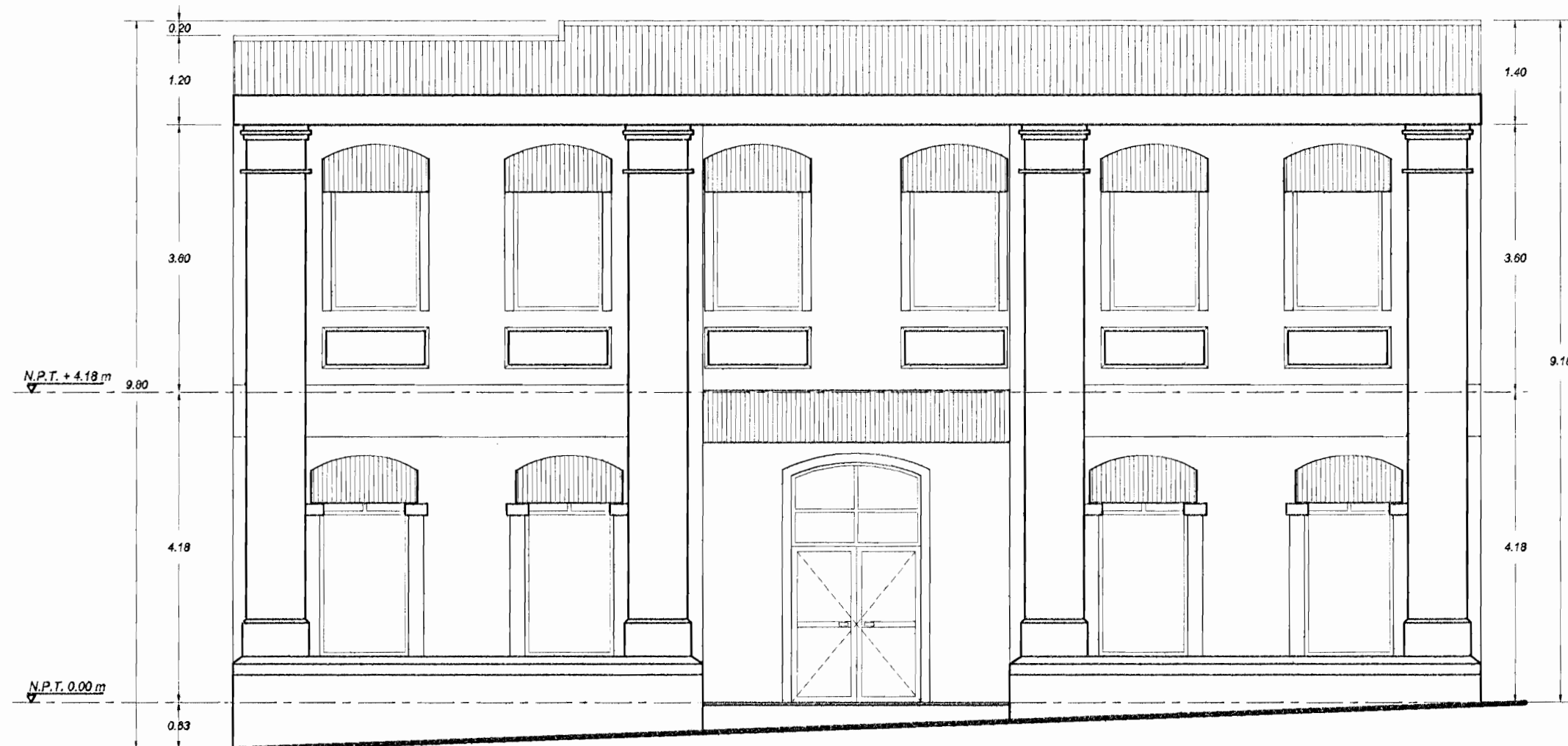
ELEVACION PRINCIPAL ESCALA 1:75

ANTEPROYECTO : REMODELACION FECHA : 13 de Setiembre 1999