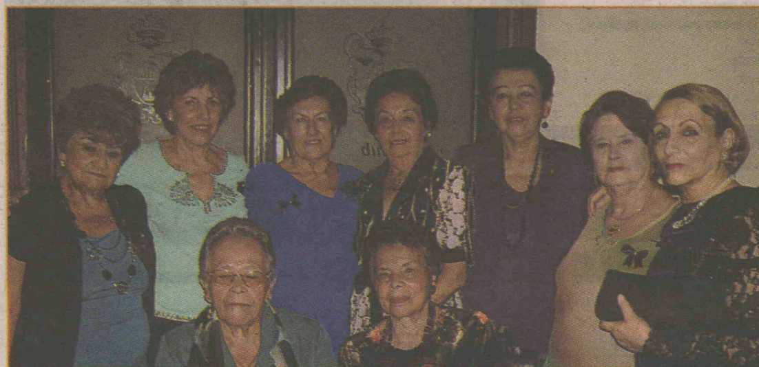
Socias de la Asociación Floral y de Horticultura de Cartago.