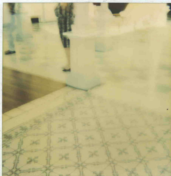
Club Social de Cartago febrero 1999