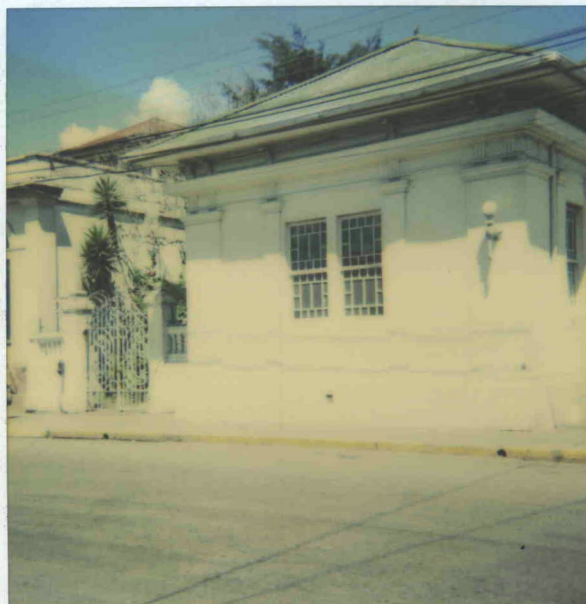
Club Social de Cartago febrero 1999