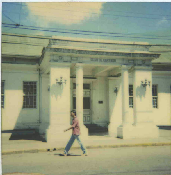
Club Social de Cartago febrero 1999