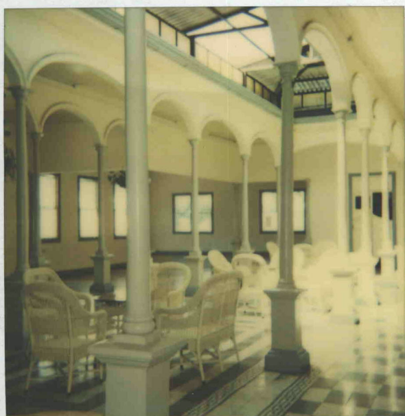
Club Social de Cartago febrero 1999