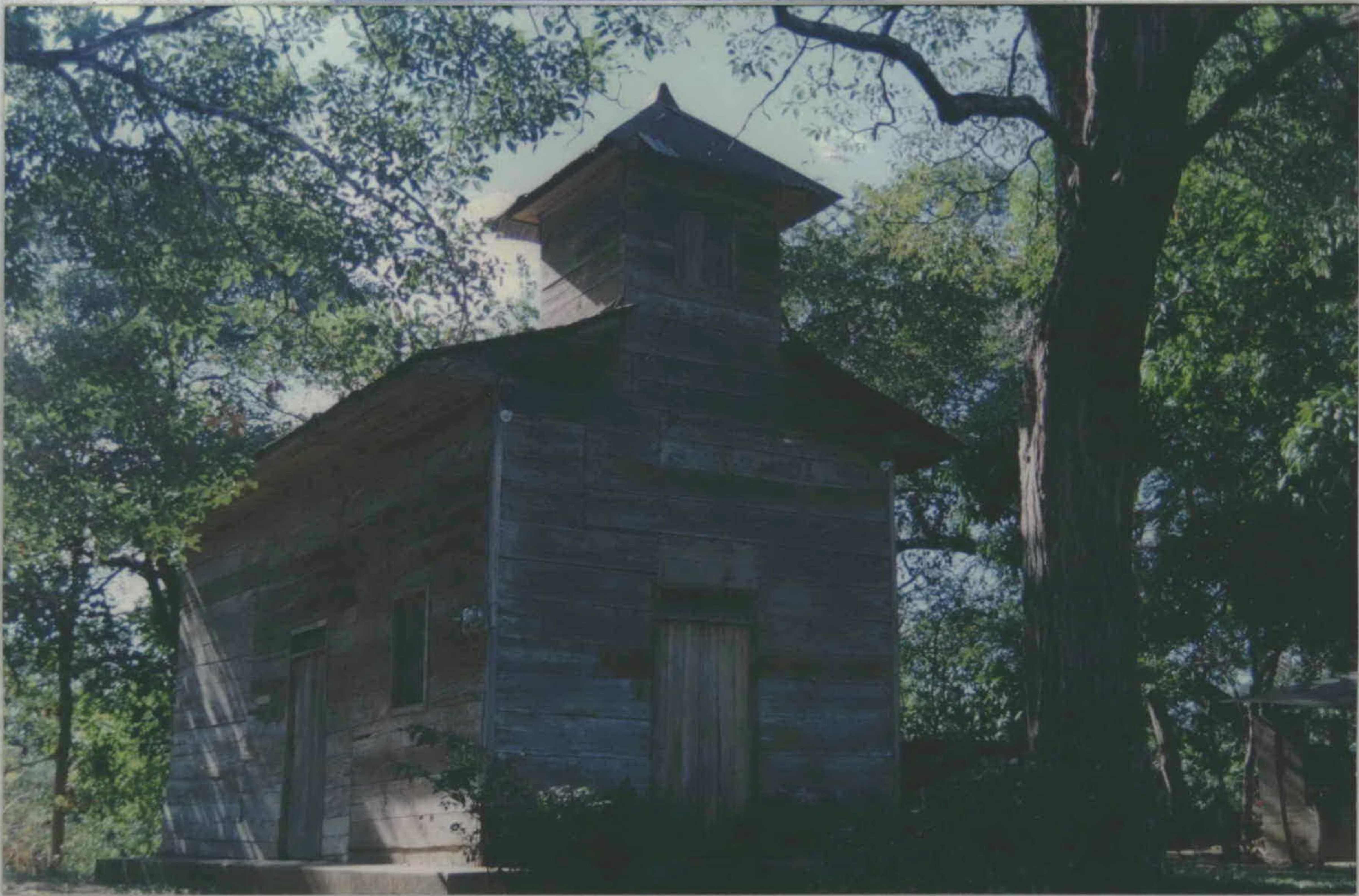
Fachadas laterales, ermita de las Mercedes, Guardia, Liberia.