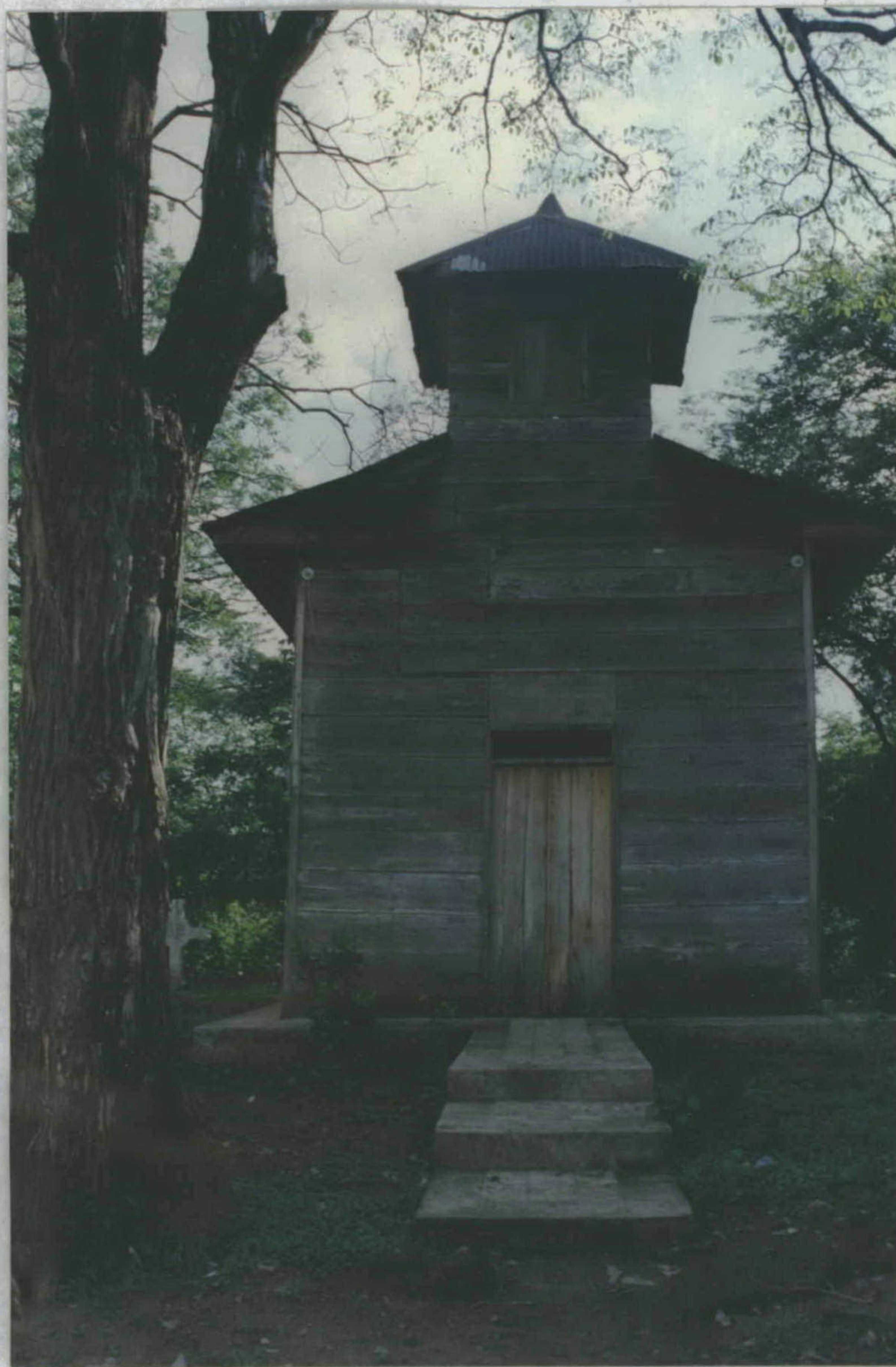
Fachada principal, ermita de las Mercedes Guardia, Liberia

CENTRO DE INVESTIGACION Y CONSERVACION DEL PATRIMONIO CULTURAL M. C. J. D.