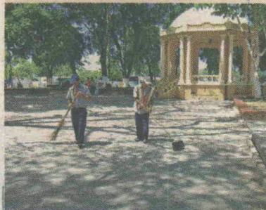
La feria ser  en el parque Ignacio P rez, de Esparza.

CENTRO DE INVESTIGACION Y CONSERVACION DEL PATRIMONIO CULTURAL M. C. J. D.