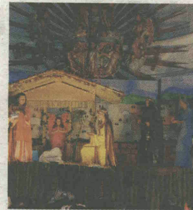
La llegada de los reyes magos es una tradición.