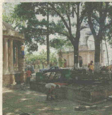
Obras estarían listas el 18 de diciembre.