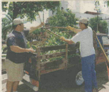
Las labores se realizaron la semana pasada.

La empresa Agro Jardines y Paisajes, con el apoyo de la administración de una heladería, se encargó de podar seis árboles ubicados en el parque Ignacio Pérez, en este cantón porteño. Misael Cordero, administrador de la empresa, comentó que la iniciativa se adoptó después que vecinos le hablaron sobre el descuido en que estaban los árboles. RONNY SOTO , CORRESPONSAL