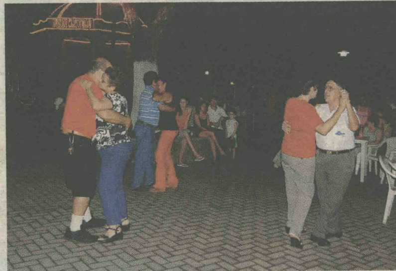
A bailar. El parque Pérez fue una amplia pista de baile.

Desde la tarde, las mesas y sillas fueron colocadas a lo largo y ancho de la explanada del parque Pérez, bajo una fuerte y rápida lluvia que en principio parecía que iba a opacar una noche que estaba preparada para el baile y el disfrute.